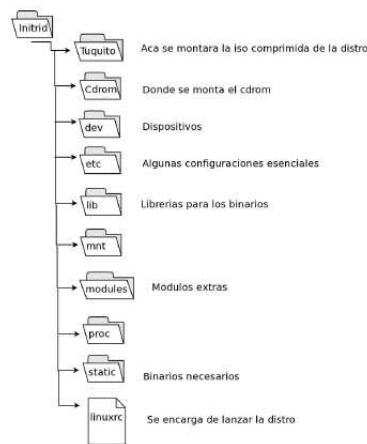
Figura 1: Initrd de GARFIO.